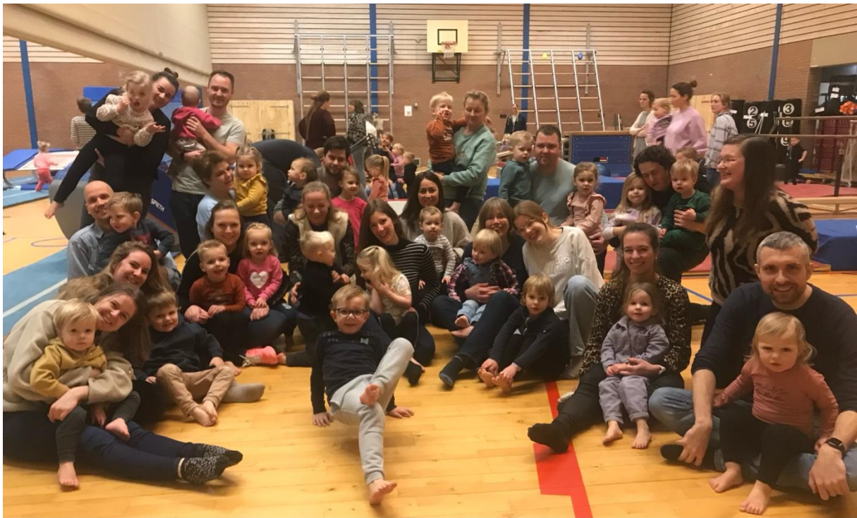
6 januari 2024 – allerlaatste SPARTA-les in Wethouder Balvers sportzaal door peuters & kleuters

Op zaterdag 26 oktober vindt in Sportcentrum Zanderij SPARTA UNITED plaats, een demonstratie door zoveel mogelijk les- en wedstrijdgroepen voor familieleden en vrienden. De kleutergroep tekende voor het openingsnummer. En de senioren toonden hun vitaliteit met een work-out. De lesgroepen turnen voor meisjes toonden hun kunnen op sprong, brug, balk en vloer.